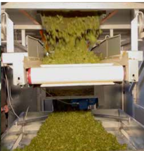
Weg in die Trocknung